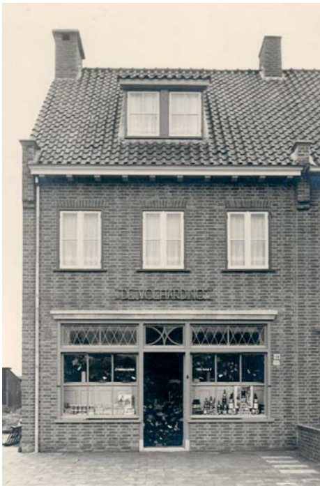
Het in 1942 herbouwde winkelpand.