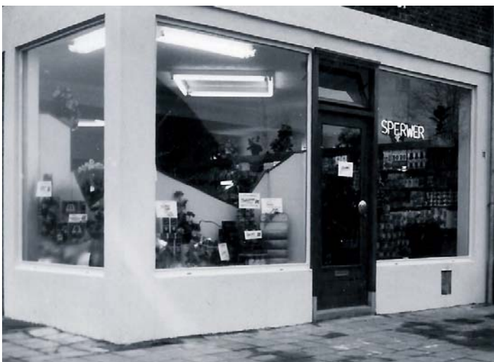
De Volharding - De Sperwer in 1957.