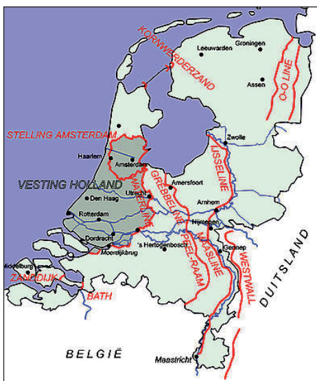
Nederlandse verdedigingslijnies 1940.