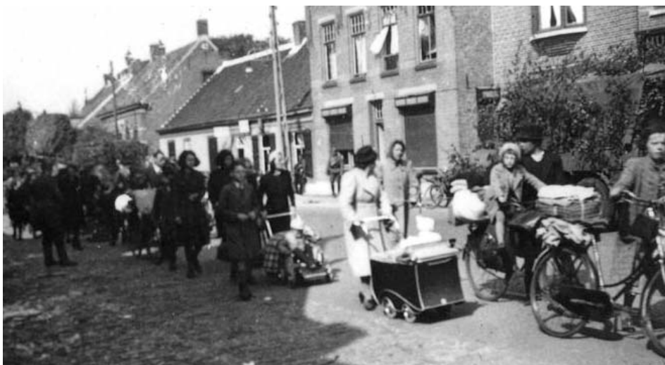
Vluchtende bewoners in mei 1940.

Over de noodzaak van die evacuatie, beter bekend als De Vlucht, wordt zeer verschillend gedacht. De botsing tussen de linies van de Franse en Duitse eenheden werd weliswaar verwacht bij Breda, maar vond daar niet plaats. Er vielen echter wel gewonden en dodelijke slachtoffers door de Duitse beschietingen vanuit de lucht op de Franse troepen, waardoor tevens een aantal vluchtende mensen werden getroffen. Door een bombardement op een school in Sint-Niklaas op 17 mei 1940, die mede voor vluchtelingen uit Breda als onderkomen diende, stierven ook een aantal vluchtelingen uit Breda. Totaal kostte de Vlucht een honderdtal mensenlevens. Voor velen luidt dan ook de conclusie dat de evacuatie totaal onnodig was en tot (te) veel slachtoffers heeft geleid. Het was en is natuurlijk enorm triest, zeker ook voor de familieleden, dat zoveel