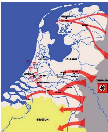
De inval op 10 mei 1940.

Zeer vroeg in de ochtend van 10 mei 1940 zetten de Duitse legers de aanval in op Nederland, België en Luxemburg als onderdeel van Fall Gelb, het Duitse aanvalsplan voor de Lage Landen. Daarna zou plan Fall Röt volgen om Frankrijk te bezetten. Hoewel Nederland een verdedigingsplan kende met diverse verdedigingslijnies, zie het kaartje, werd Nederland zeer snel ingenomen. Toen de Peel-Raamstelling in oostelijk Noord-Brabant moest worden opgegeven lag de weg naar het westen van Noord-Brabant open.