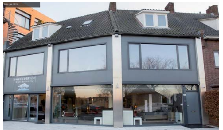
Latere uitbreiding met twee blokken in oostelijke richting tot de huidige situatie.

Hebt u nog herinneringen aan het vroegere Heusdenhout of mogelijk foto's uit die tijd? We nemen uw verhaal graag op. Uw oude foto's scannen we zorgvuldig voor het archief van heemkundekring Paulus van Daesdonck en u krijgt ze ongeschonden retour. Alle voorgaande verhaaltjes over het kapeldorp Heusdenhout vindt u op http://www.breda-oost.nl/uitheusdenhouts-historie Reacties over dit verhaal kunt u geven via nieuws@heusdenhout.nl of 076 5810024. Werkgroep Heusdenhouts Historie.