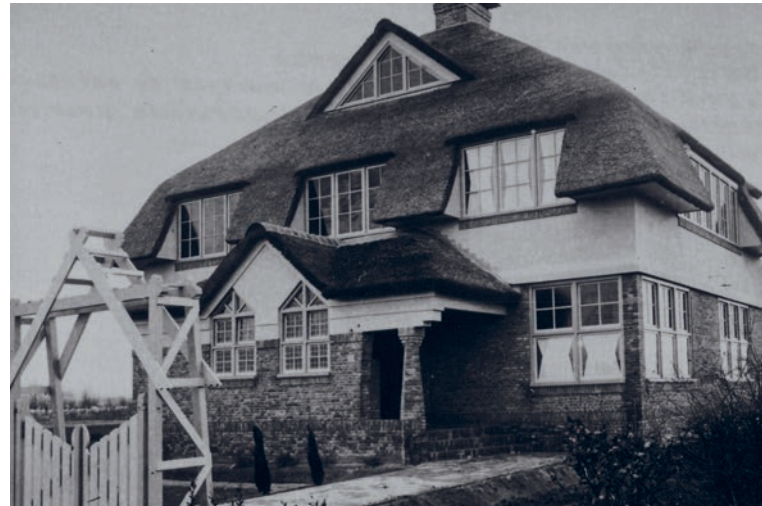
▲ E.K.-huis Hero Teteringsdijk D 184.