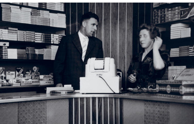
▲ Het chique interieur van tabakswaarenzaak Kennis met op maat gemaakte kasten en toonbank.