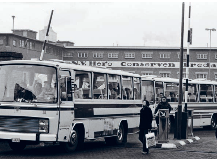
▲ Medewerksters uit België op weg naar huis.