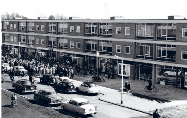
▲ Opening van winkelcentrum Epelenberg op 26 april 1960 met muziek. Een mooi complex bij een park en met een zeer brede stoep met daarop grote plantenbakken.

Met twee jonge kinderen en de kosten van de nieuwe winkel is de begintijd financieel zwaar. De familie van Zus helpt mee door de huuropbrengsten van een paar panden aan het jonge stel te gunnen. Verder klust Wim de eerste jaren bij als slager. Tenslotte verhuren ze de ruimte achter de winkel aan bakkerij