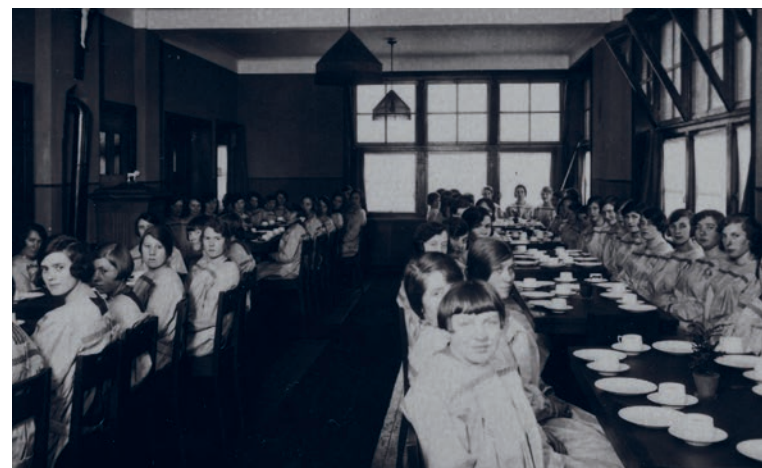
▲ De Hero-fabrieksmeisjes in het E.K.-huis.

De fabrieksmeisjes van de Hero werden tijdens hun pauze opgevangen in een speciaal gebouwd huis, het E.K.-Huis Hero. Hier kregen de meisjes een maaltijd en werd er tevens aandacht geschonken aan hun (zedelijke) vorming.