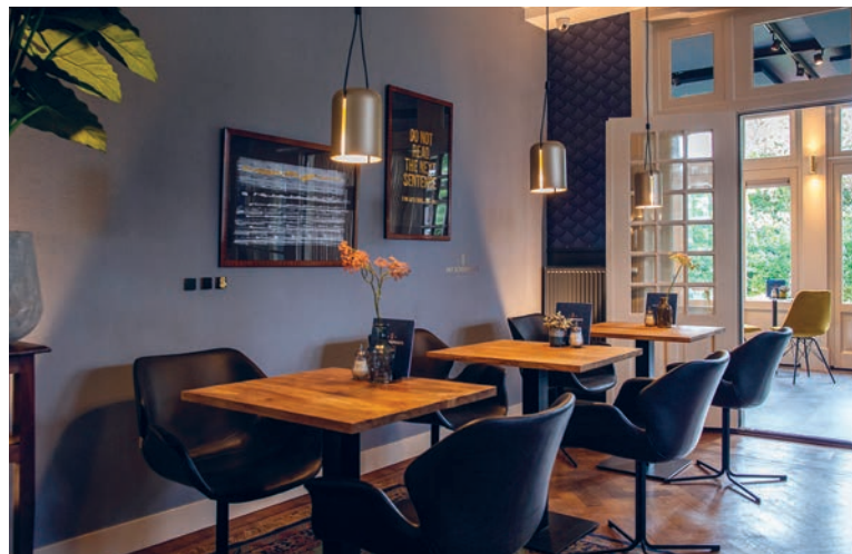
▲ De oude woonkamer is nu een lounge met bar

"De oude woonkamer hebben we omgetoverd tot een lounge met bar. Daar serveren we gave koffies maar ook goede wijnen. Mensen kunnen bij ons terecht voor een lunch of borrel, maar ook om lekker te werken in een inspirerende omgeving."