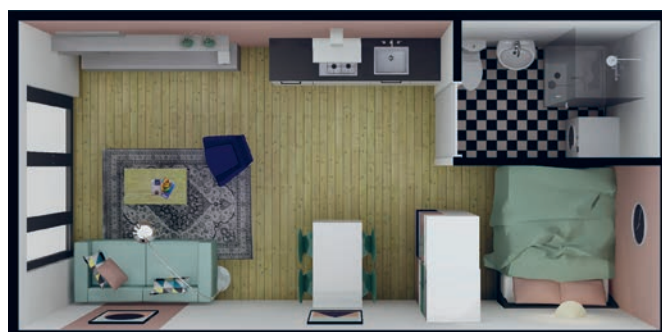
Indicatie indeling woning