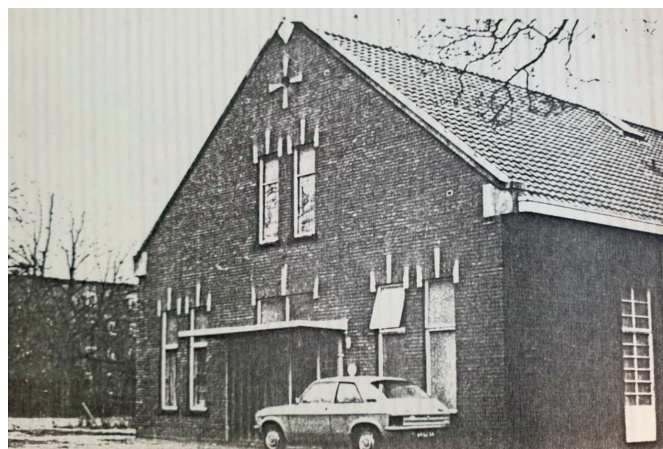
Het oude Rode Kruis gebouw was verbonden met het Ignatiusziekenhuis

Kijk voor meer informatie op de site www.sanquin.nl of loop gewoon eens binnen op de Sint Ignatiusstraat 6 in Breda