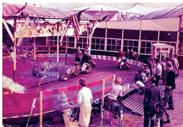
▲ De kermisattractie met scootertjes van de firma van der Tuin uit Heusdenhout.

Het was eind oktober 1959. De Bredase kermis op de Oude Vest en het Kloosterplein, waar wij sinds jaren stonden met onze scootertjes, [zie foto] was nog aan de gang. Mijn vader had een stuk grond gekocht in Heusdenhout in de toenmalige gemeente Nieuw-Ginneken. Het perceel was gelegen aan de Heusdenhoutseweg tussen de huisnummers 4 en 6. Het kreeg de aanduiding 4A. Dat zou onze nieuwe overwinteringsplaats worden voor onze wagens en kermisattracties. Op een zonnige dag, nog voor het opengaan van de kermis, ging ik mee met mijn vader en oudere broer naar "het terrein" zoals we dat noemden.