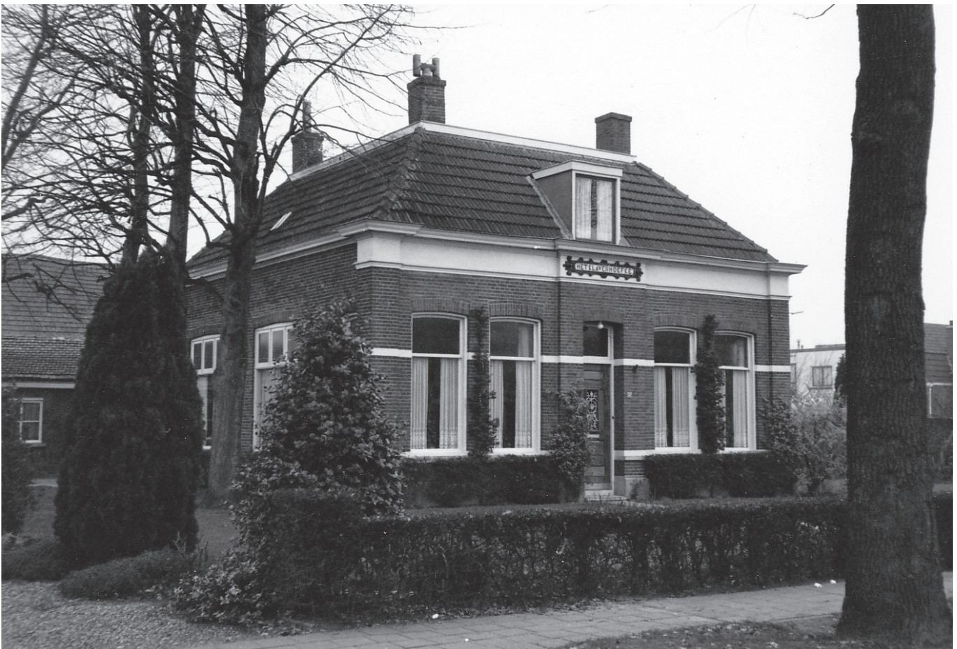
▲ Op de wei nabij het nog bestaande Klaverhoefke stond de jaarlijkse Heusdenhoutse kermis.

Echter, mijn vader was nu zover dat hij dat niet meer nodig achtte en nam zelf de verdediging op zich. In de zomer van 1960 werd de gemeente Nieuw-Ginneken door de rechter in het ongelijk gesteld. De gemeente mocht mijn vader niet belemmeren in het uitoefenen van zijn bedrijf. Een woonwagen voor het gezin was daarbij essentieel.