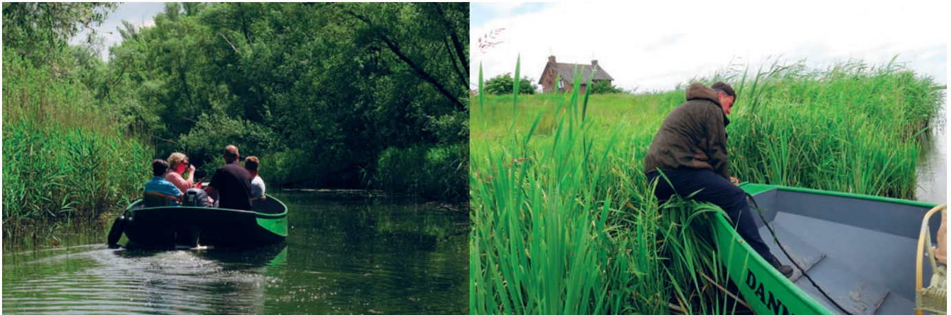
▲ Heerlijk genieten van het mooie weer op het water.