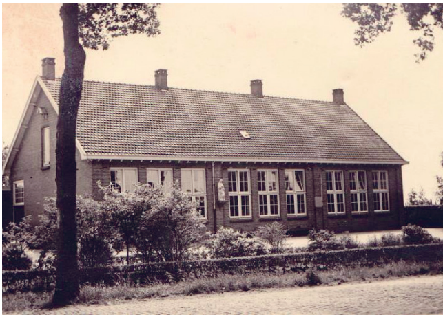
▲ St. Annaschool te Heusdenhout