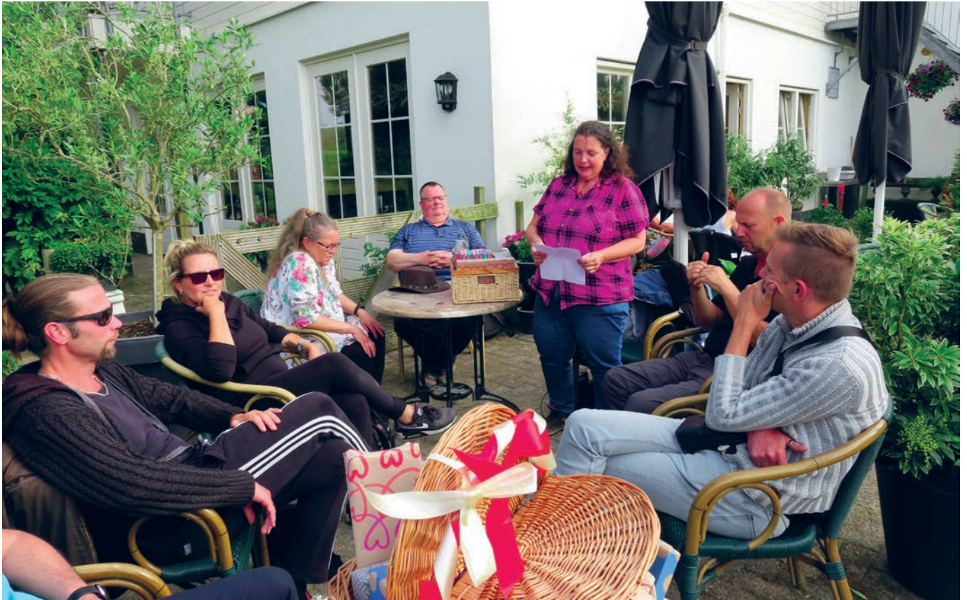
▲ Een laaste borrel weer aan de vaste wal