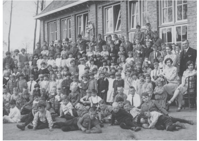
▲ Onderwijs aan de Heusdenhoutse jeugd.