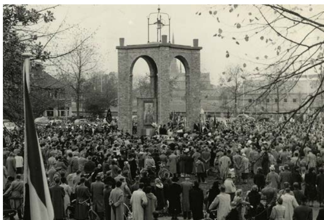
▲ Inwijding van de Poolse Kapel op 31 oktober 1954.

Deel I gemist? Dit is terug te lezen via www.breda-oost.nl