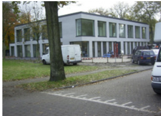
▲ Het gezondheidscentrum Kapelhof in aanbouw vanaf de Kapelstraat