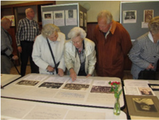
▲ Voor tentoonstellingen