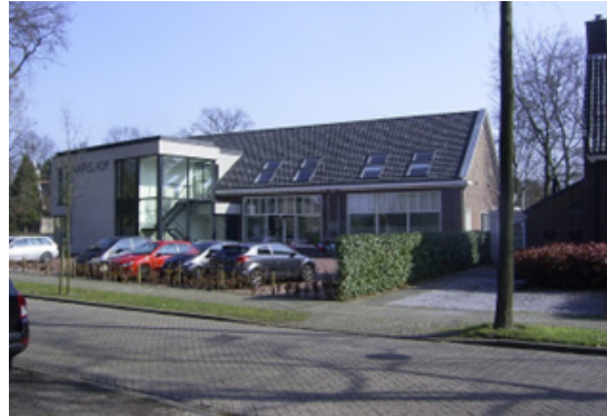
▲ Al nagenoeg tien jaar een aanwinst voor Heusdenhout