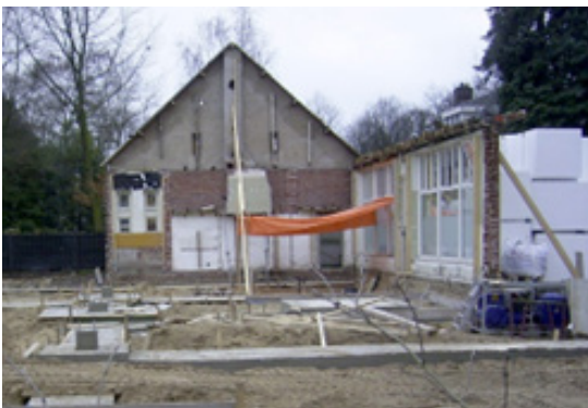
▲ Enkele oude elementen werden in de nieuwbouw opgenomen