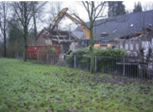
▲ De sloop voorafgaand aan de hernieuwbouw