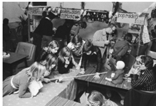
▲ Voor vele en diverse activiteiten