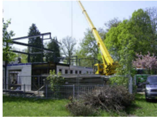
▲ Het gezondheidscentrum gaat de hoogte in