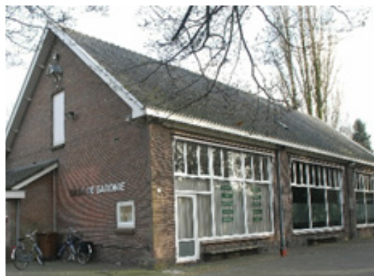
▲ Als gemeenschapshuis Kapelhof