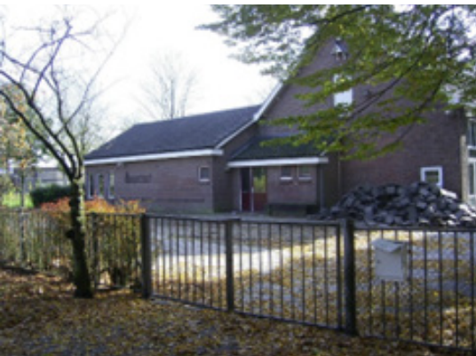
▲ Een volgende functie: buurthuis De Kapelhof in Heusdenhout