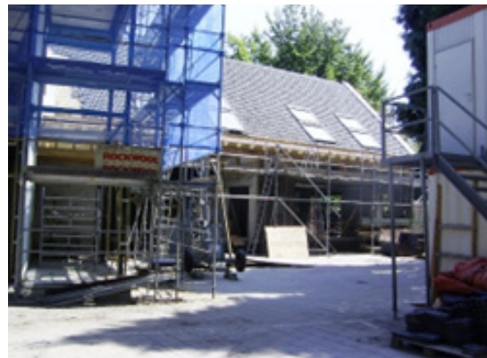
▲ De contouren van de oude school zijn herkenbaar