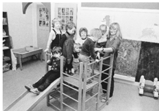
▲ Als kinderopvang