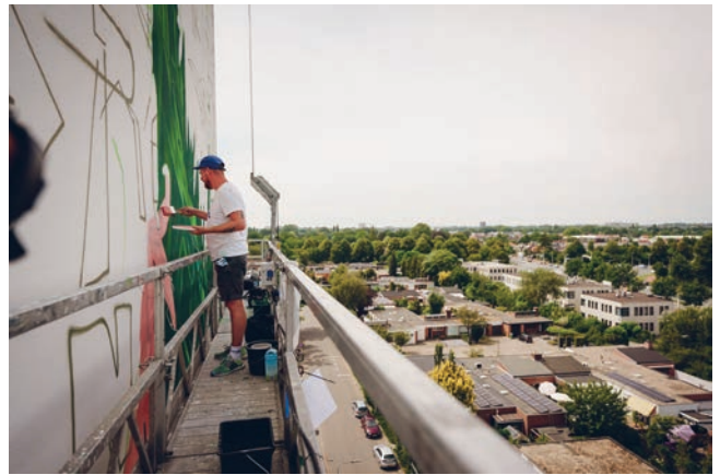
▲ De kunstenaar aan het werk. Foto: Rob Lipsius

◀ Het 38 meter hoge stilleven op de gevel van Residentie Bergschot in juli 2022. Foto: Rob Lipsius