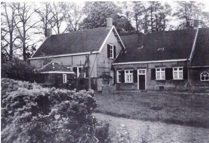
De nog bestaande hoeve De Blauwe Kei.

Tegenover de huidige Korte Raamstraat bevond zich eind negentiende eeuw een clustertje van vier boerderijtjes. Twee daarvan waren eeuwen oud. Uit 1662 stamde de oorspronkelijke hoeve die in 1772 met de oude materialen werd herbouwd. Ook de Vlaamse schuur stamde uit die tijd. Deze was gedekt met riet en de wanden waren gemaakt van met stro en leem bedekte gevlochten wilgentenen.