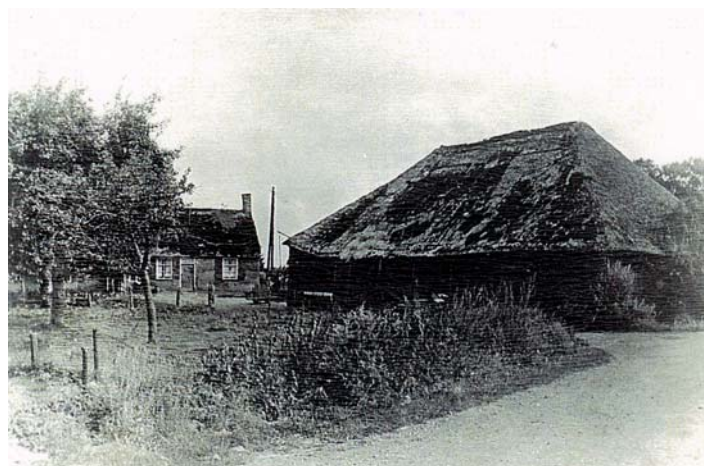
Boerderij Molengrachtstraat (later Poolseweg) 175.