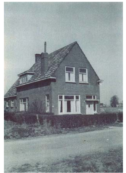
Het nog bestaande huis Molengrachtstraat (later Poolseweg) 173.

Piet Backx was echter al na twee dagen teruggegaan en ging 's morgens en 's avonds het achter-