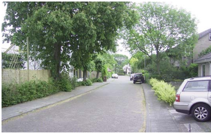
Kapelstraat, vroeger Heusdenhoutsestraat, huidige situatie

wijken. Zij moesten toen hun oude boerderij aan de Poolseweg in de buurtschap Molengracht opgeven. Deze stond ter plekke van het huidige parkeerterrein van het Amphia Ziekenhuis. Aan de Heusdenhoutseweg werd een nieuw tuinbouwbedrijf opgericht. Ook bij hen kwam de gemeente met grote interesse voor hun huis en perceel. Zij zouden voor de tweede keer moeten vertrekken. De onderhandelingen met de gemeente verliepen zeer moeizaam. Nee, een plek elders in Heusdenhout voor hun tuinbouwbedrijf was niet beschikbaar. Moeder had bij geruchte gehoord, dat bij een onteigening in een ander stadsdeel na het vertrek van de bewoners het huis alsnog mocht blijven staan. De eerdere bewoners waren er niet terug gekomen, had zij vernomen. Er was iemand gaan wonen die bij de gemeente werkte. Om die reden eiste zij dat hun huis aan de Heusdenhoutseweg gegarandeerd gesloopt zou worden, indien zij het onverhoopt zouden moeten verlaten.