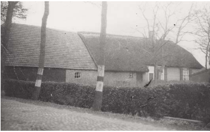
Boerderij fam. van den Boer, toen Heusdenhoutse-weg 22